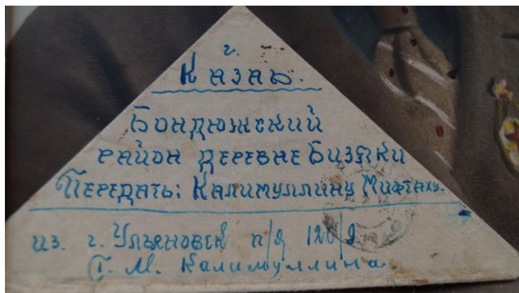
Калимуллин Гәлиәхмәтнең фронттан килгән хатлары