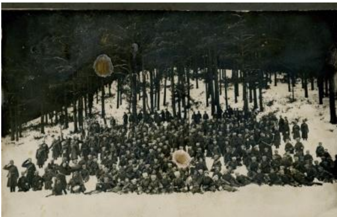
166-й запасной полк (батальон). Перед отправкой на фронт. г.Сарапул