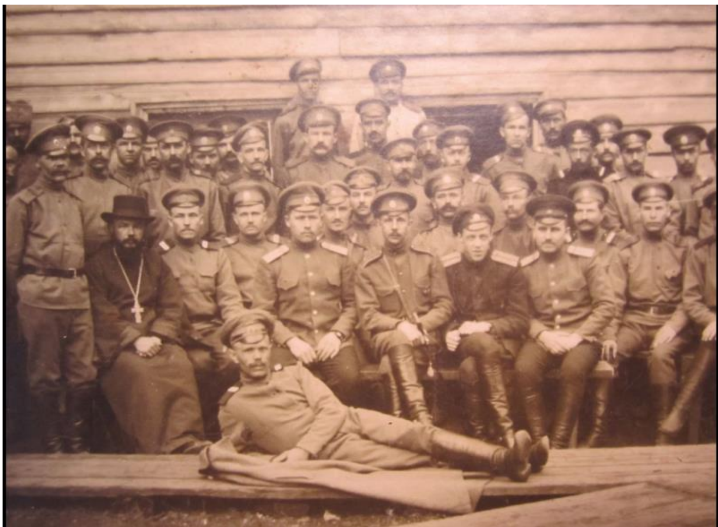
Штаб 166-го запасного пехотного полка (батальона), г.Сарапул, 1917 год