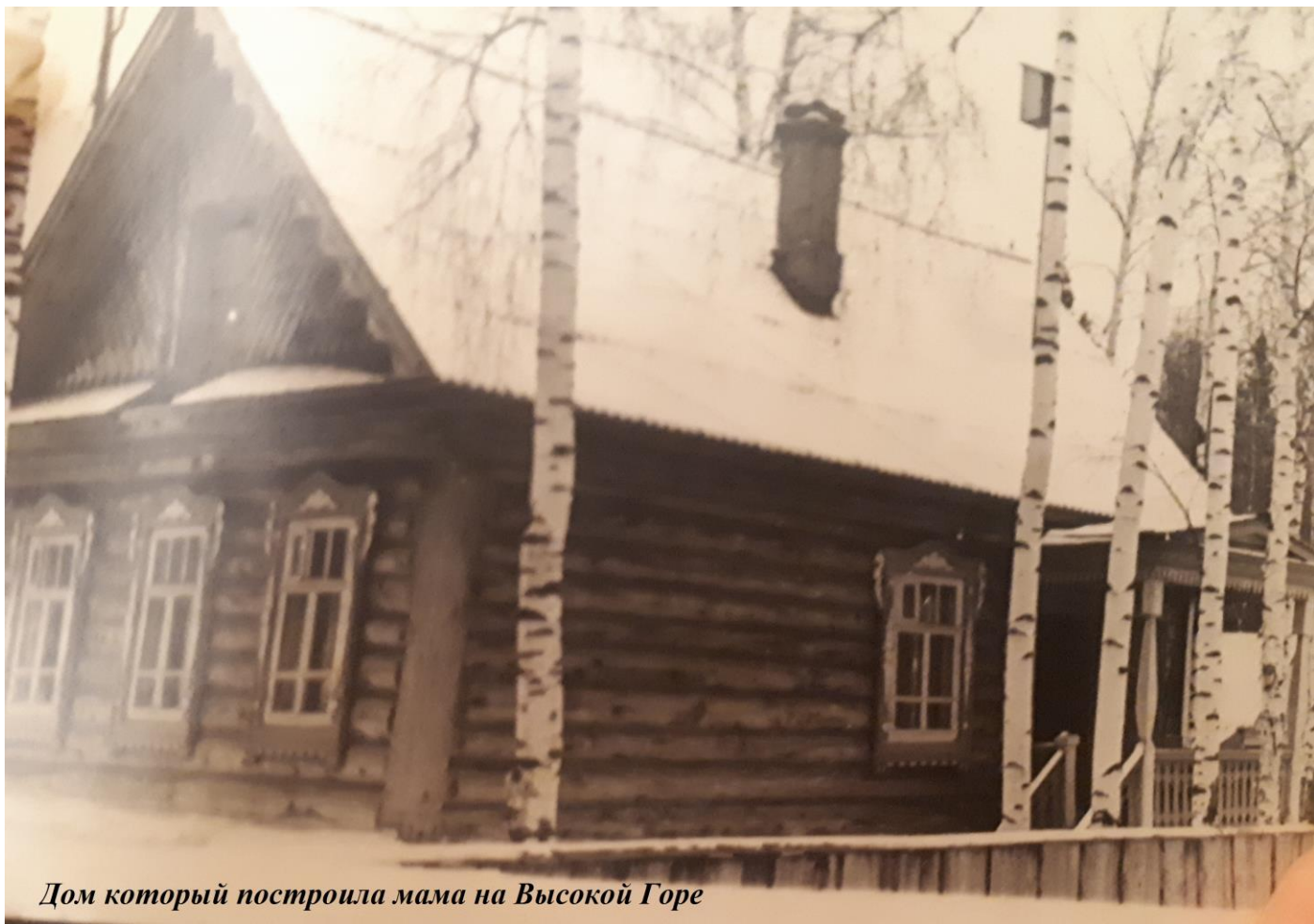
Дом который построила мама на Высокой Горе