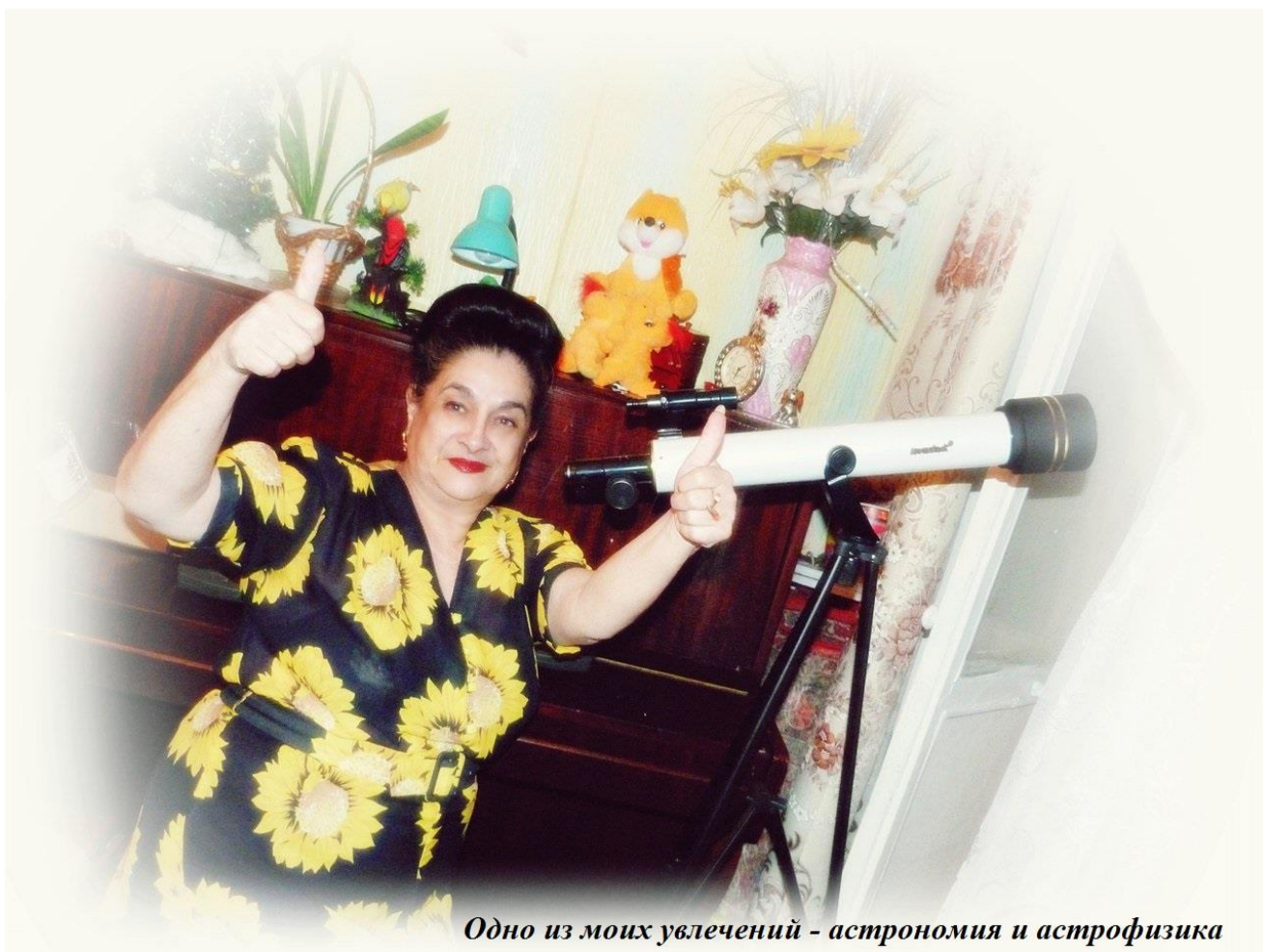
Одно из моих увлечений - астрономия и астрофизика