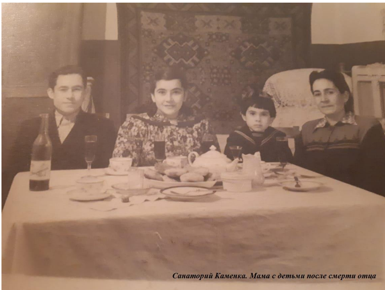
Санаторий Каменка. Мама с детьми после смерти отца