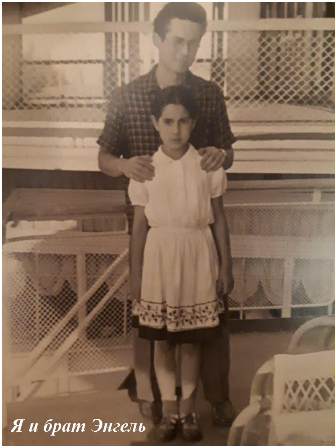
Я и брат Энгель