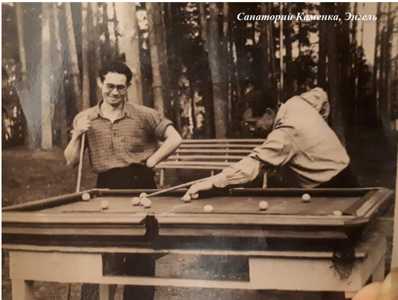
Санаторий Каменка, Энгель