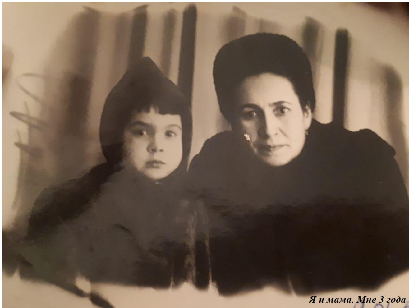
Я и мама. Мне 3 года