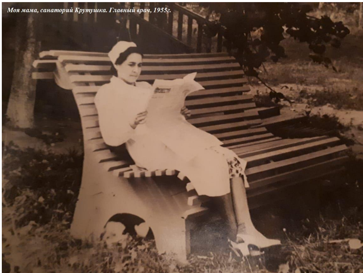
Моя мама, санаторий Крутушка. Главный врач, 1955г.