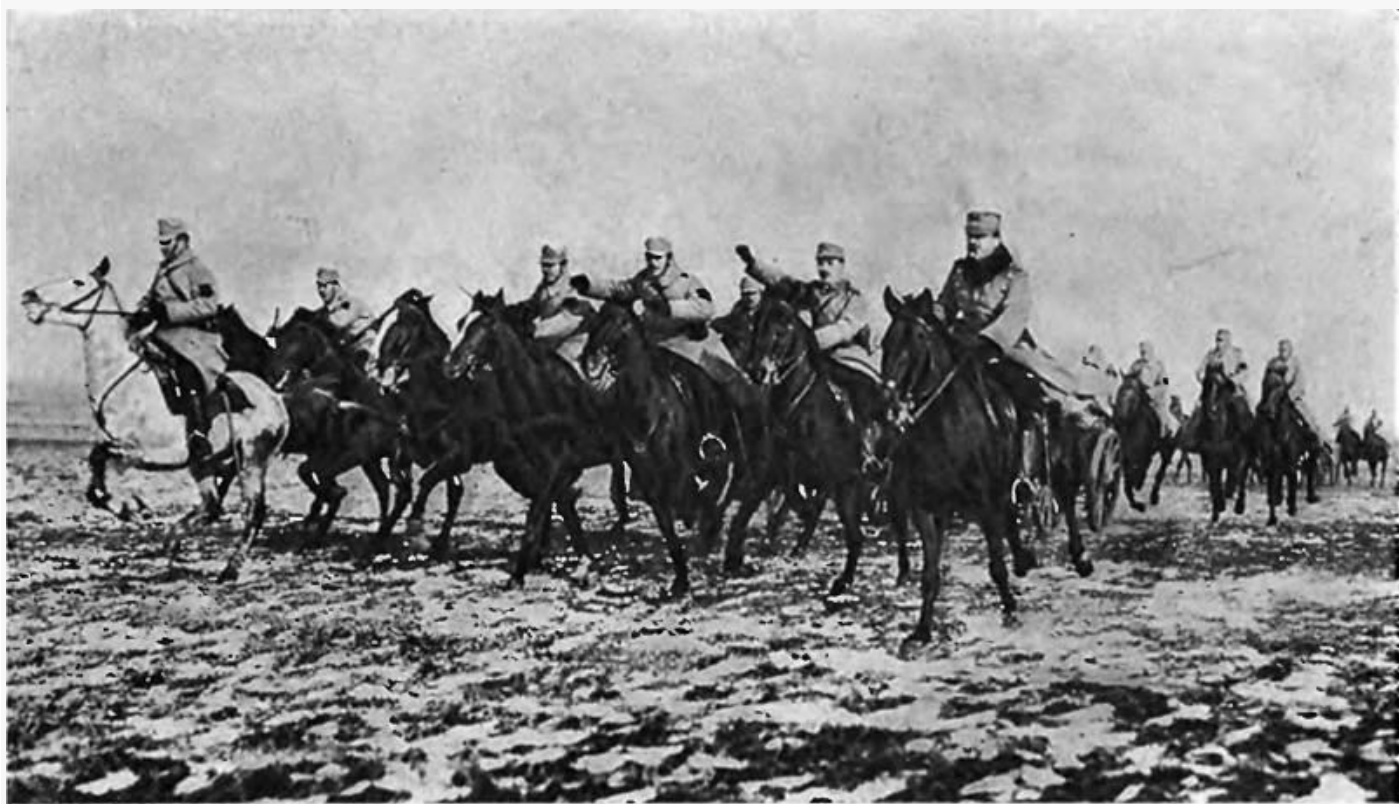
Румынская полевая артиллерия на пути к позициям. Летопись войны. № 115.

28 – 30 ноября развернулось наступление главных сил группы армий А. Макензена. Дунайская армия в первом эшелоне имела - германские 217-ю пехотную дивизию и кавалерийскую дивизию Гольца (левый фланг, направление главного удара), болгарские 1-ю и 12-ю пехотные дивизии (правый фланг, обеспечение армейской операции от действий русских войск), а во втором эшелоне – турецкую 26-ю пехотную дивизию. Особенно упорные бои развернулись у Прунари – Драганешти. Сломив сопротивление частей 2-й и 5-й румынских пехотных дивизий, германские 217-я дивизия и дивизия Гольца завязали упорные бои с румынскими 9-й и 19-й дивизиями у Баларии. Правый фланг Дунайской армии двигался вниз по Дунаю. 30 ноября, после серьезного боя у Нейлова, болгарские дивизии подошли к мест. Комана, юго-западнее Бухареста.