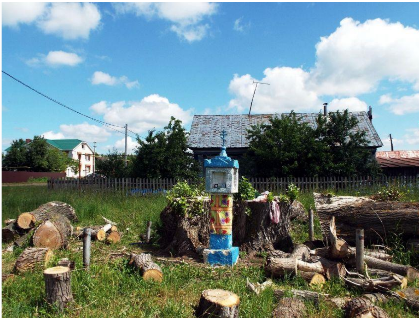
Мунайка. Часовенный столб.

Население Мунайкинского сельского поселения занимается выращиванием овощей и фруктов на своих приусадебных участках и разведением скота в личных подсобных хозяйствах, о чем свидетельствуют следующие данные: КРС всего - 69 голов; Свиньи - 20 голов; Овцы, козы - 74 головы; Птицы - 520 голов