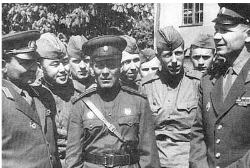
Встреча летом 1965 году на Мамаевом Кургане.