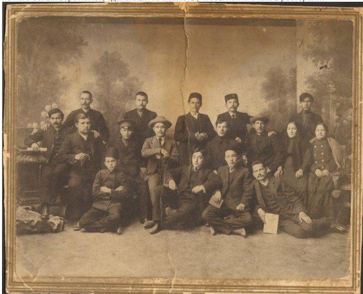
Г. Тукай (во втором ряду, третий слева) среди членов татарского драматического кружка. Астрахань. 1911.