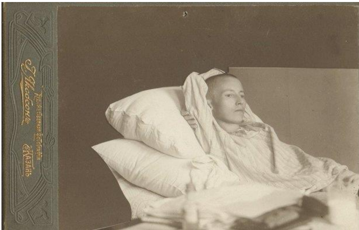
Г. Тукай в больнице Г.А. Клячкина. Казань. 1 апреля 1913.

И до самых последних дней он продолжал писать статьи и стихи.