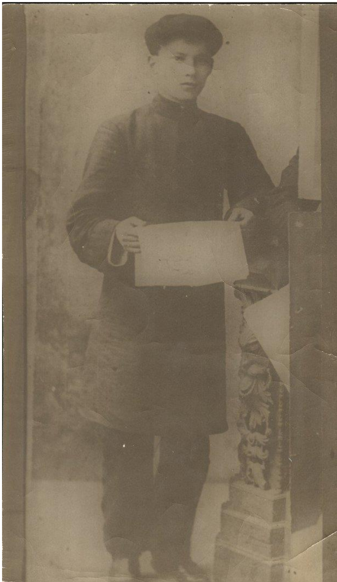
Г. Тукай в период работы в типографии. Уральск. 1905