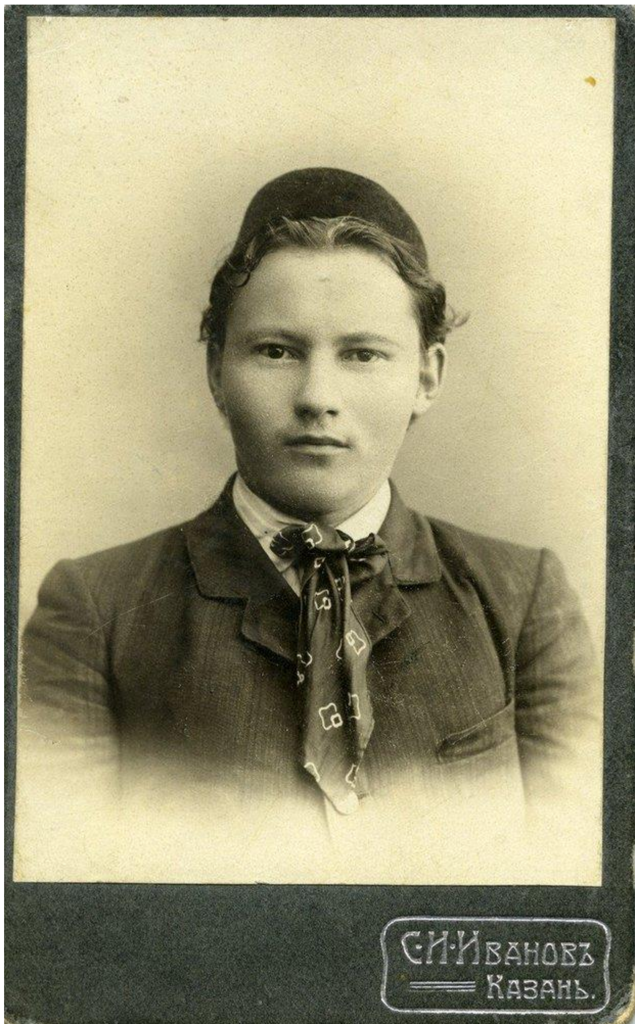
Г. Тукай. Фото на паспарту. Казань. 1908. Фотограф С.И. Иванов