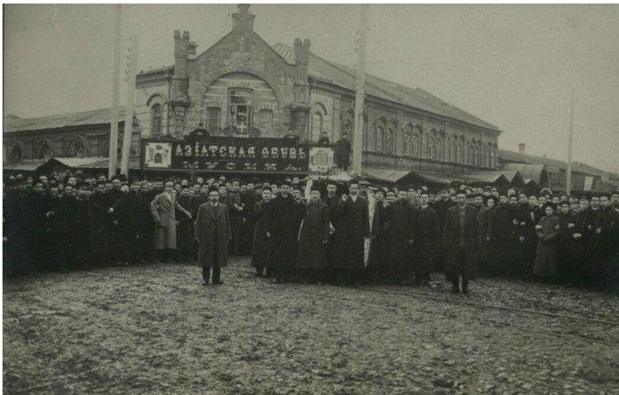
Похороны Г. Тукая. Казань. 4 апреля 1913. Фотография на бланке почтовой карточки

параллельно с ним творили десятки татарских писателей и поэтов, и все они писали примерно на одном языке. Однако только Тукаю был дан этот уникальный дар — его стихи даже в русском подстрочнике будто бы доверчиво заглядывают тебе в душу.