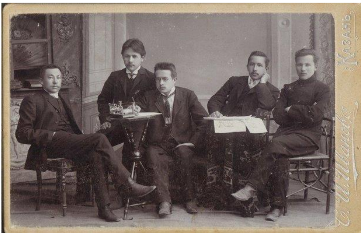
Г. Тукай (первый справа) среди членов редколлегии газеты «Эль-Ислах». Казань. 1907—1908.

Интересный факт: Габдулле Тукаю принадлежит первый продакт-плейсмент на татарском языке. По заказу чайной компании «Караван» в 1908 году он написал стихотворение «Тэулек», в котором откровенно прорекламирал определенный сорт чая. Получил великий татарский поэт за это 25 рублей. Кстати, это стихотворение впоследствии еще очень долго не включали ни в одно собрание его сочинений: как же, «наше все», а до такого опускался.