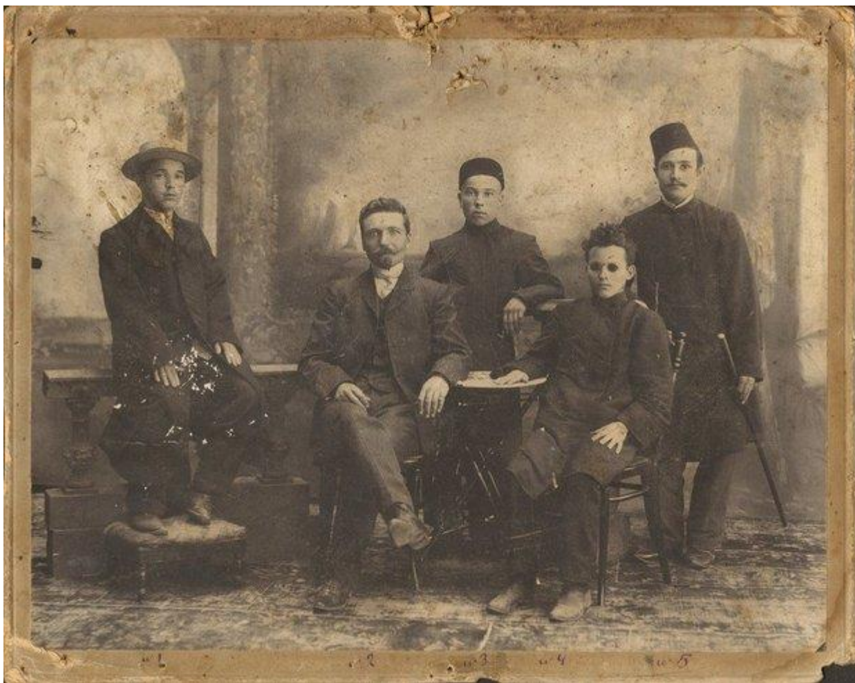
Г. Тукай среди уральских товарищей. Уральск. 1906.