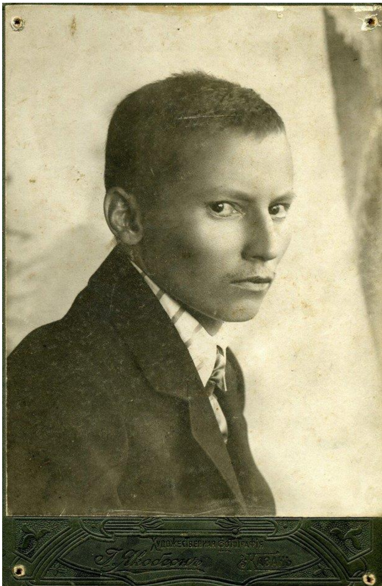
Г. Тукай. Казань. 1912.

В 1912 году, во время визита в Петербург, под сильным давлением тамошней татарской интеллигенции он обратился к врачу. В книге Фридериха приводится цитата, в которой поэт обращается к