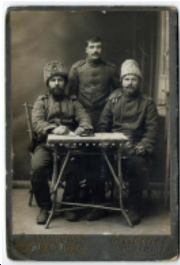
Солдаты 306 Мокшанского пехотного полка

2-я армия (в составе этой армии воевал 306 пехотный полк)