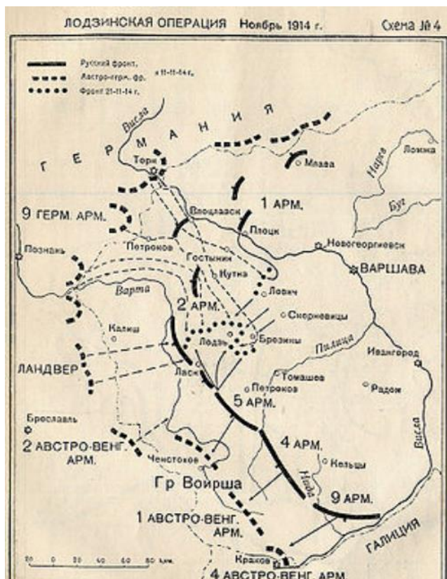
Дислокация 2-й армии во время Лодзинской операции, осень 1914 года.

2-я армия (в составе этой армии воевал 306 пехотный полк)