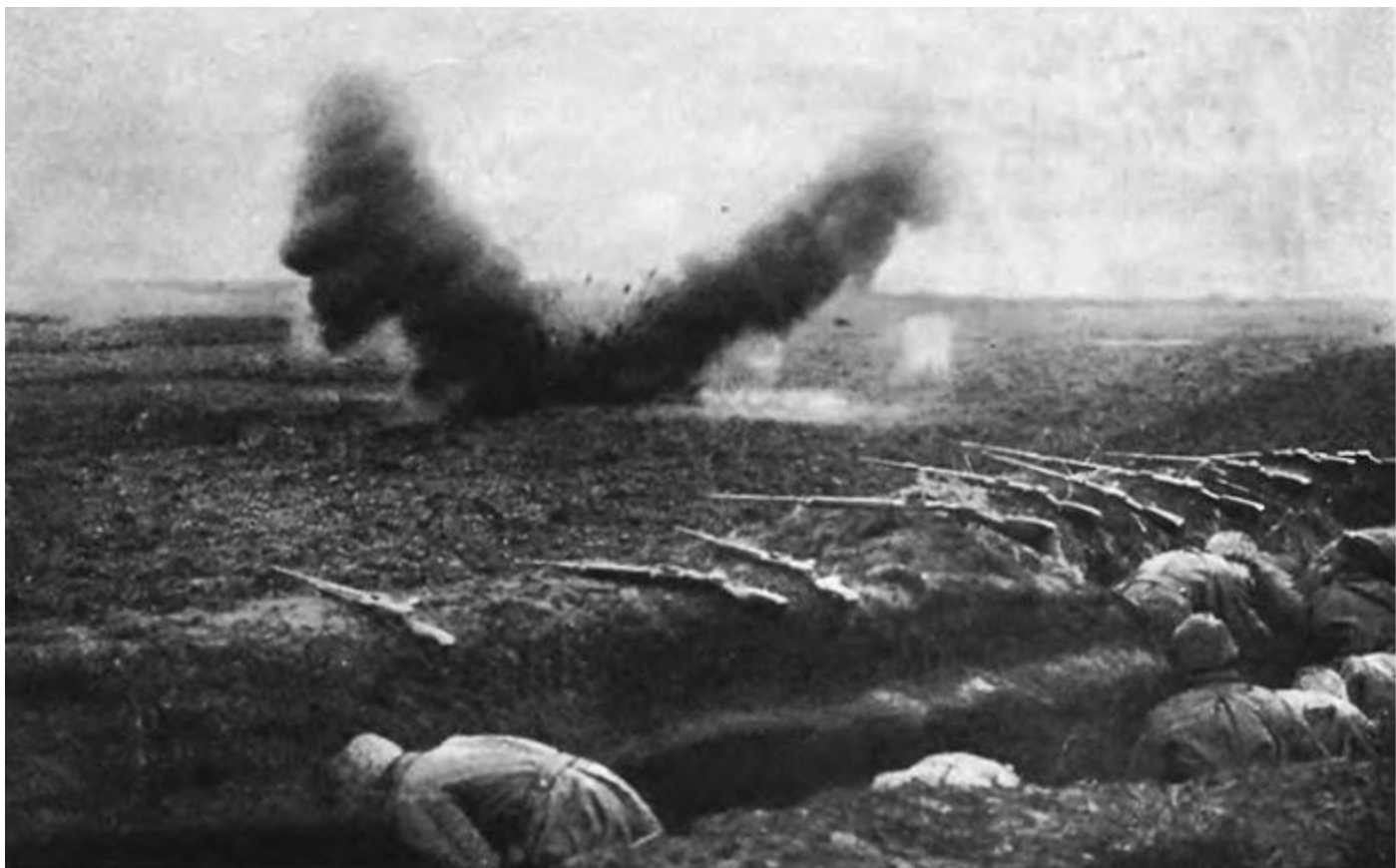
Позиции 2-й армии под Воля-Шидловецкой