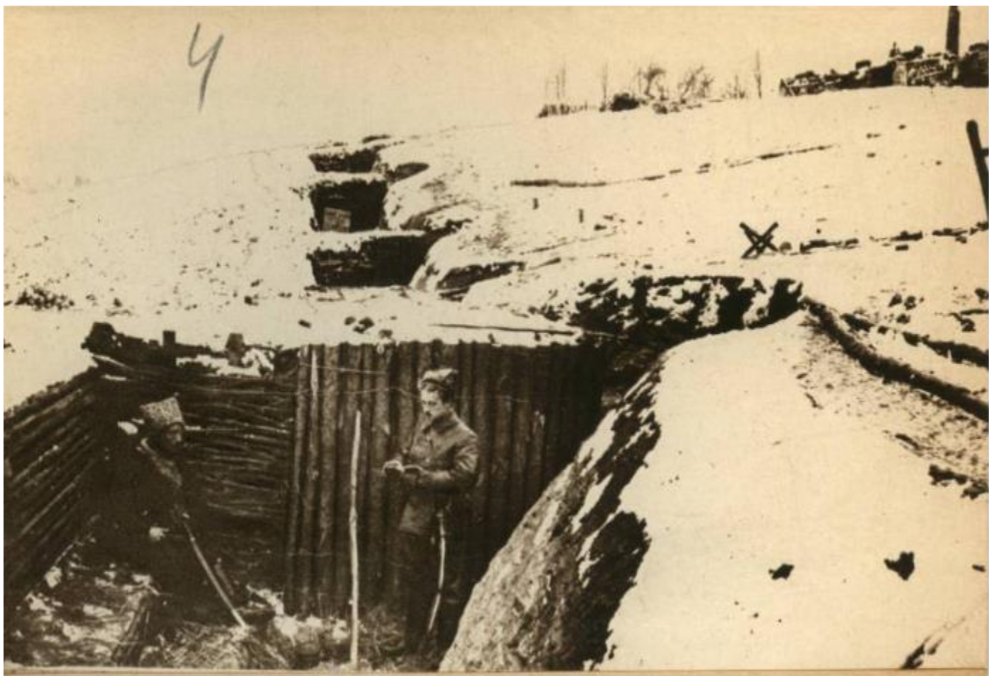
Русские окопы в Польше. Зима 1915 года