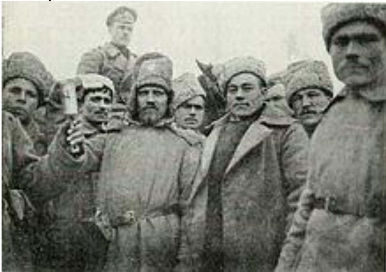
Солдаты Беломорского полка на фронте Первой мировой.

6 апреля 1863 г. из этого батальона и бессрочно-отпускных 5 и 6-го батальонов Невского пехотного полка был сформирован двухбатальонный Невский резервный пехотный полк, переименованный 13 августа того же года в Беломорский пехотный полк и развернутый 21 августа того же года в трёхбатальонный состав; 25 марта 1864 г. полк получил № 89. В 1865 г. Беломорскому полку было пожаловано Георгиевское знамя, с надписями под орлом: «1733—1833 гг.» и «За взятие приступом Варшавы 25 и 26 августа 1831 г.», при особом Высочайшем рескрипте, устанавливавшем связь 1-го батальона Беломорского полка с морскими полками, учрежденными императрицей Анной Иоанновной в 1733 году.