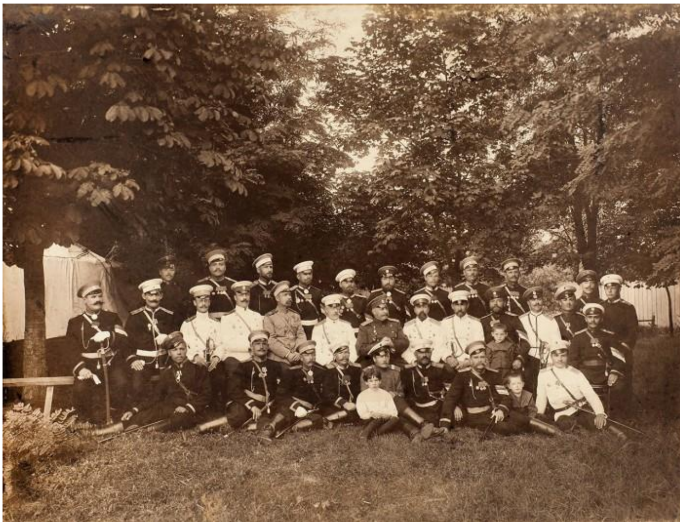
Офицеры 46 пехотного полка