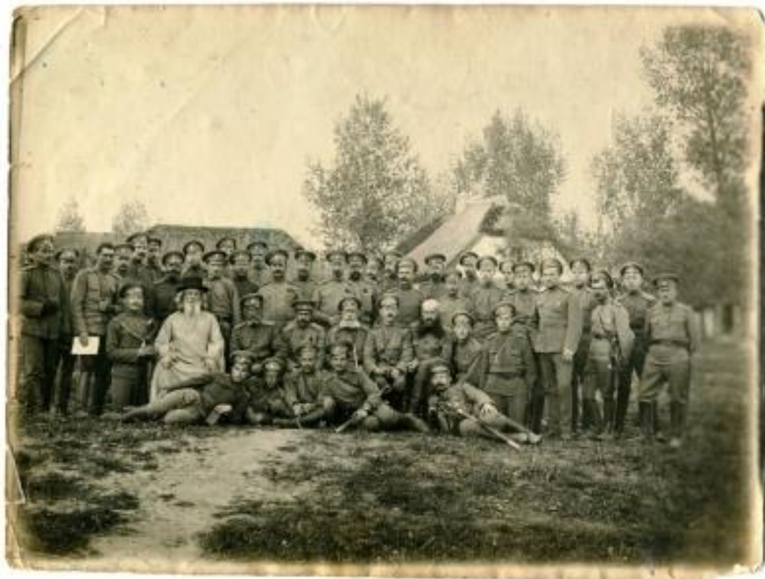
Офицеры 11-го Сибирского стрелкового полка

В марте 1918 г. –3-я Сибирская Стрелковая дивизия, вместе с входившим в ее состав 11-м Сибирским стрелковым полком, расформирована в Пермской губернии .