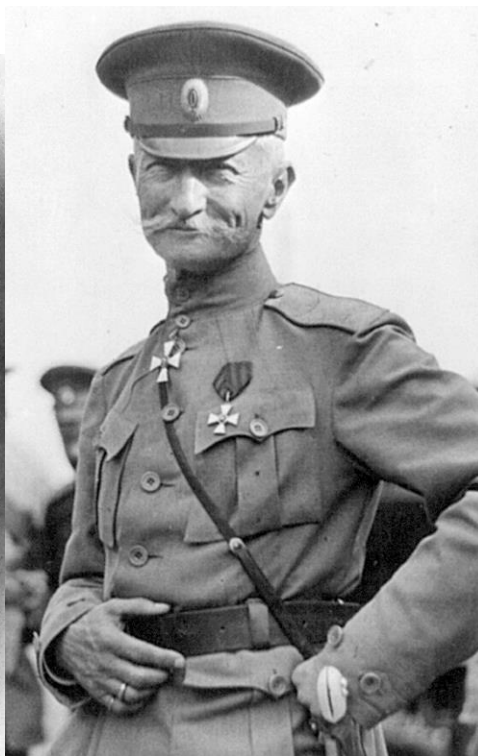
Брусилов Алексей Алексеевич