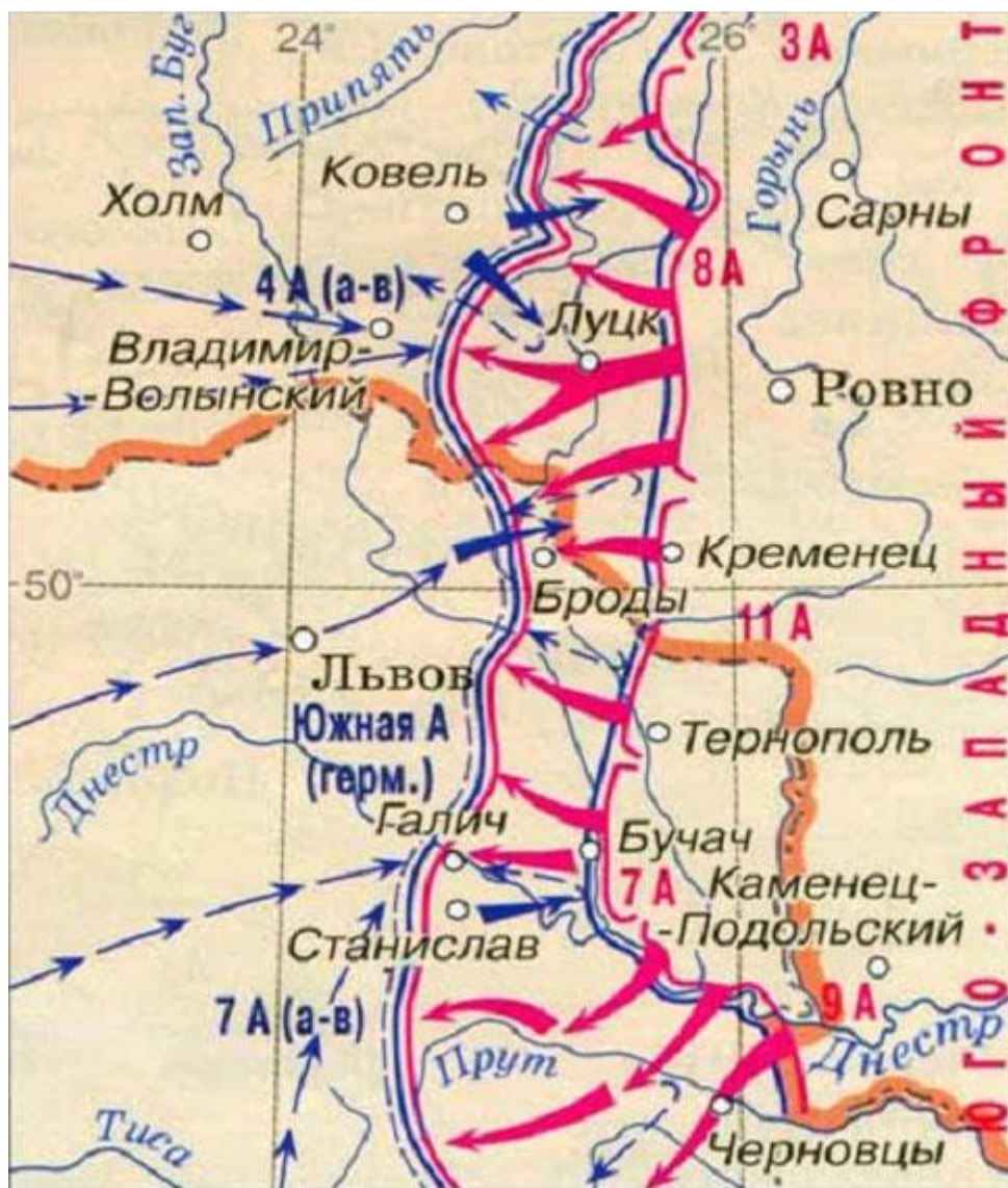
Карта Брусиловского прорыва