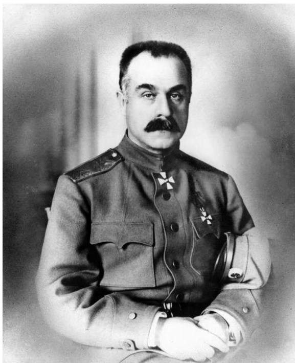
Каледин Алексей Максимович