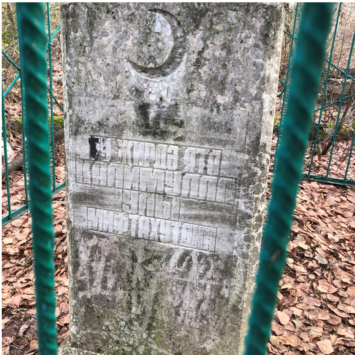
Калимуллин Мифтахетдинның Базәкә зыяратында кабере. 2023 ел, ноябрь