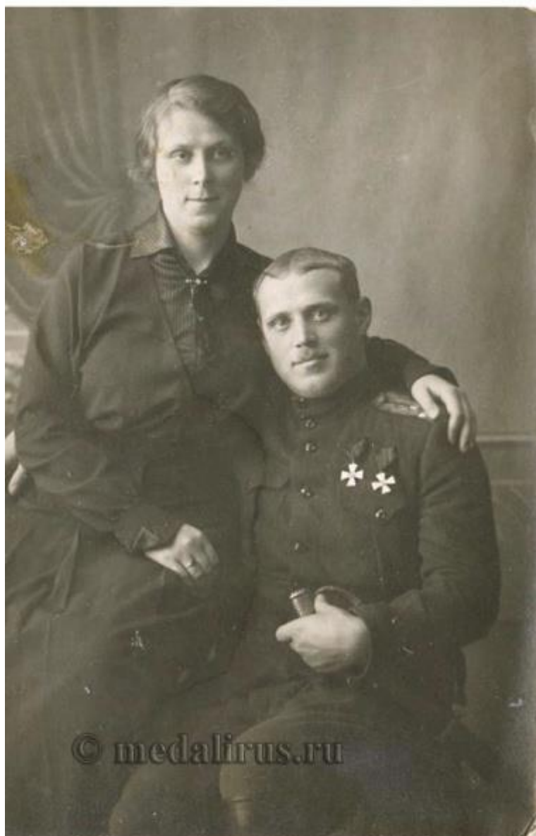
Офицер 73-го пехотного Крымского полка с женой