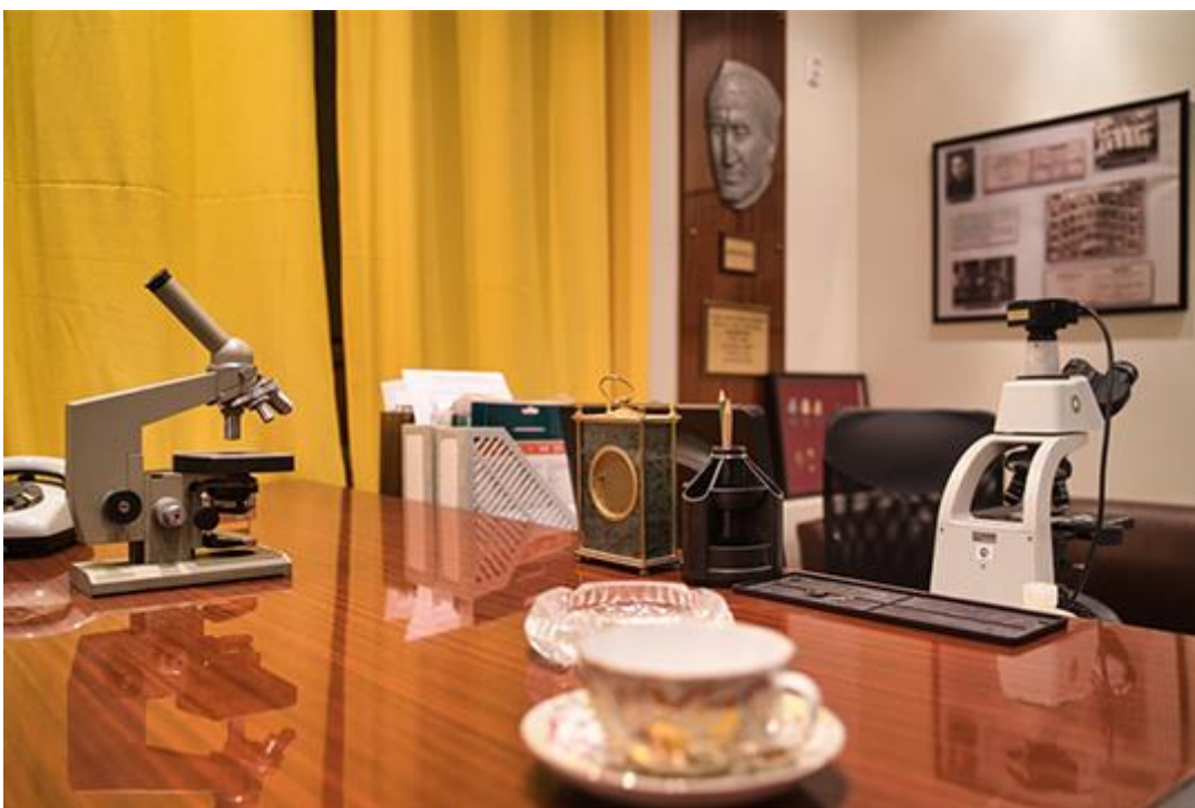
Сегодня в рабочем кабинете Сигала — музей, который используется по совместительству и как рабочее помещение