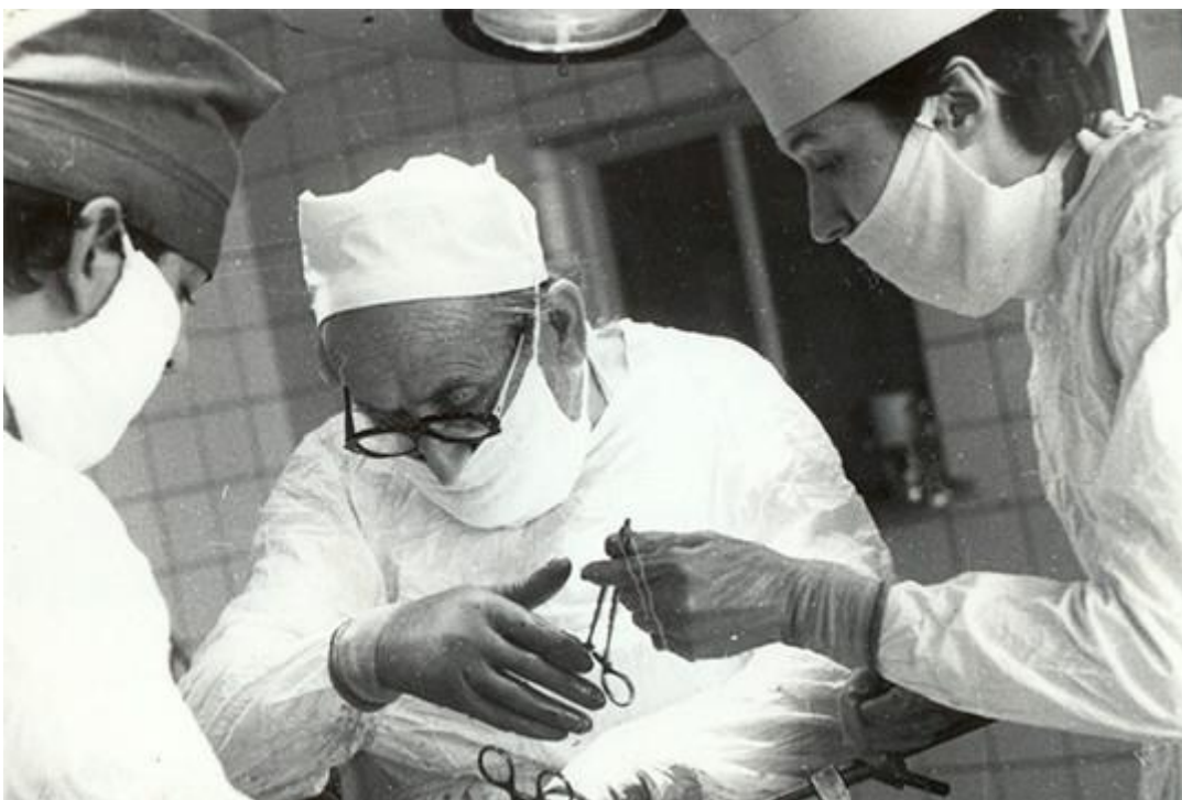
Последний шов — он трудный самый