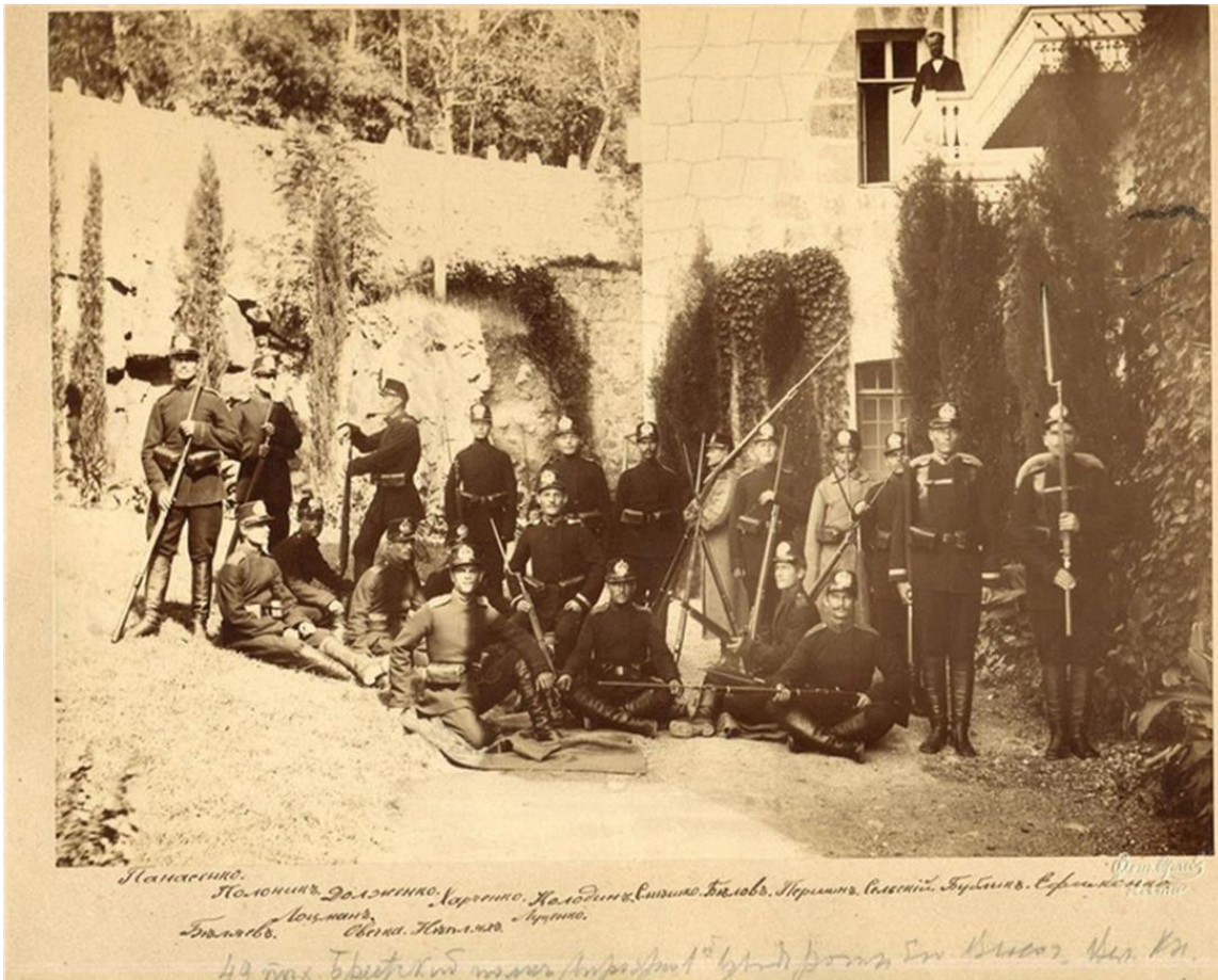
Офицеры и солдаты 49-го Брестского пехотного полка в Крыму