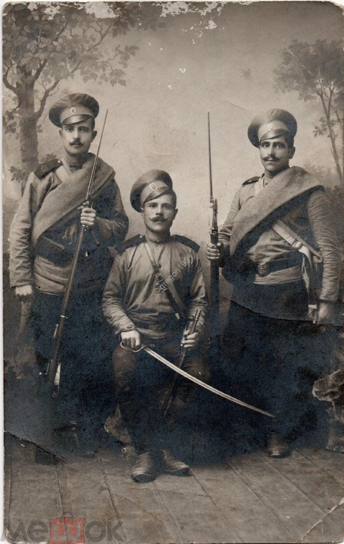
Нижние чины 49-го Брестского пехотного полка