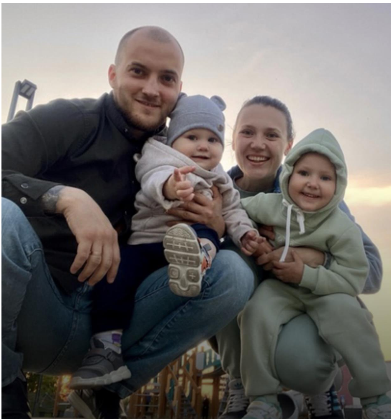
Внук Мугаллимы апа с семьей, г.Тюмень