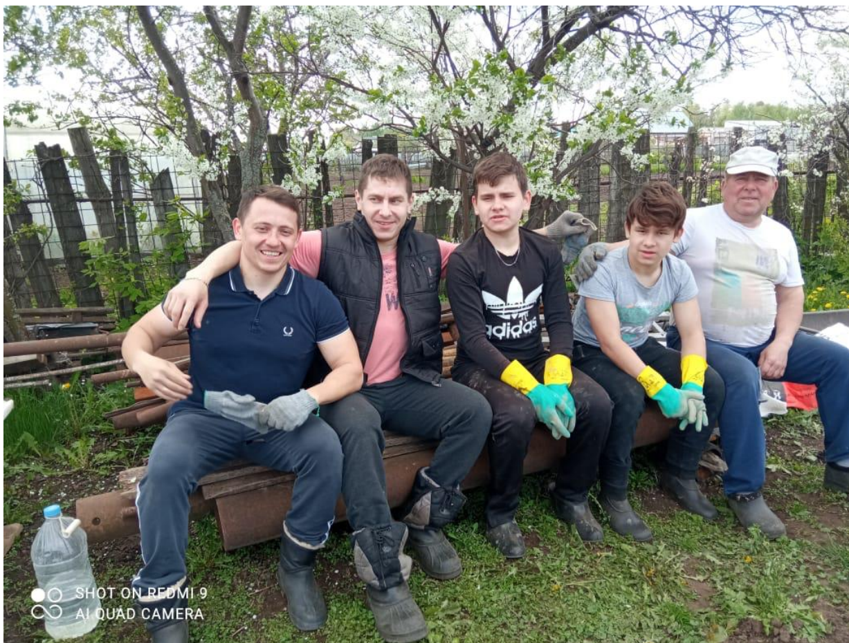
«Безнең егетләр»-Галимулла абый балалары, оныклары