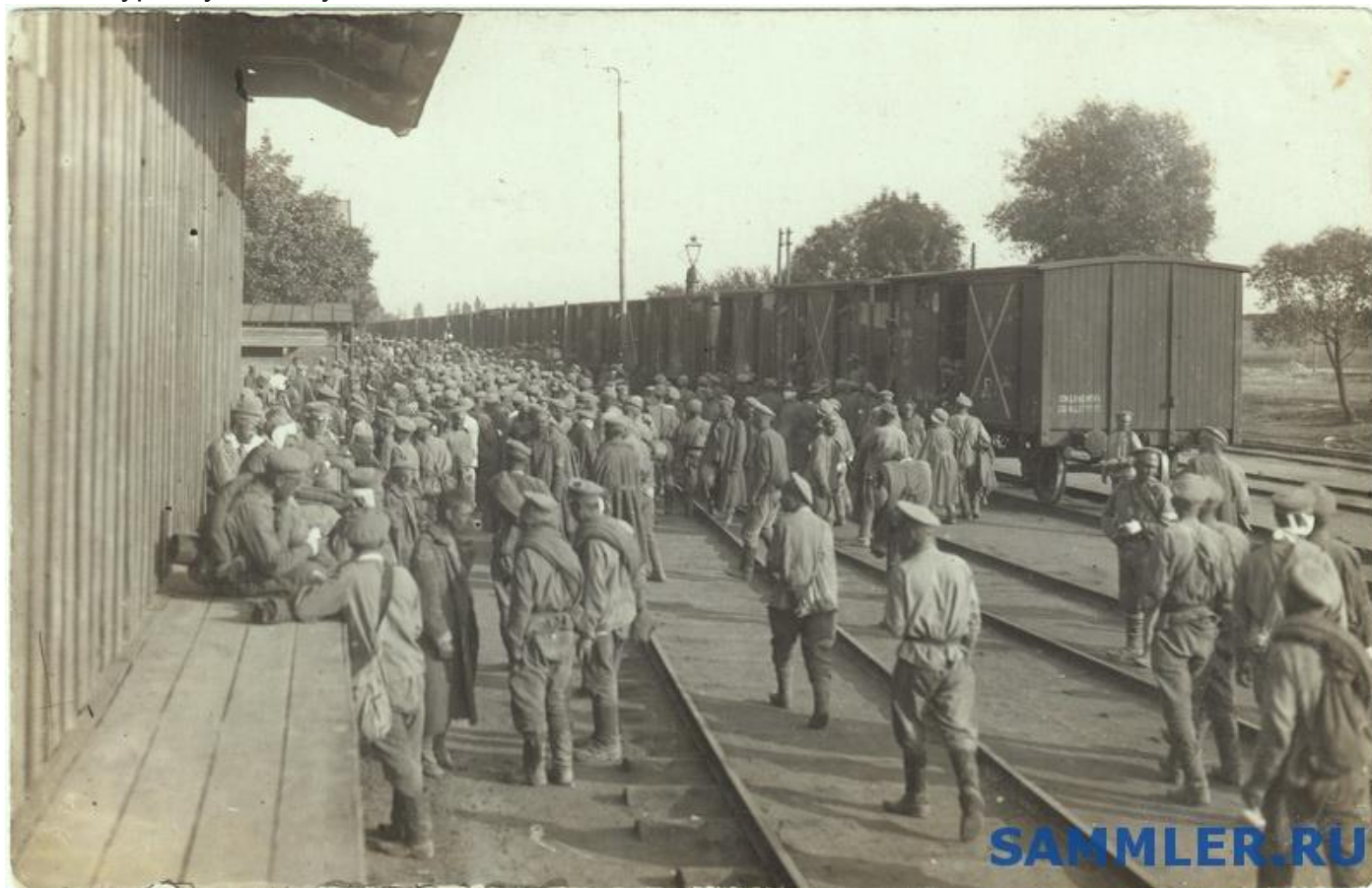
Отправка раненых в лазарет