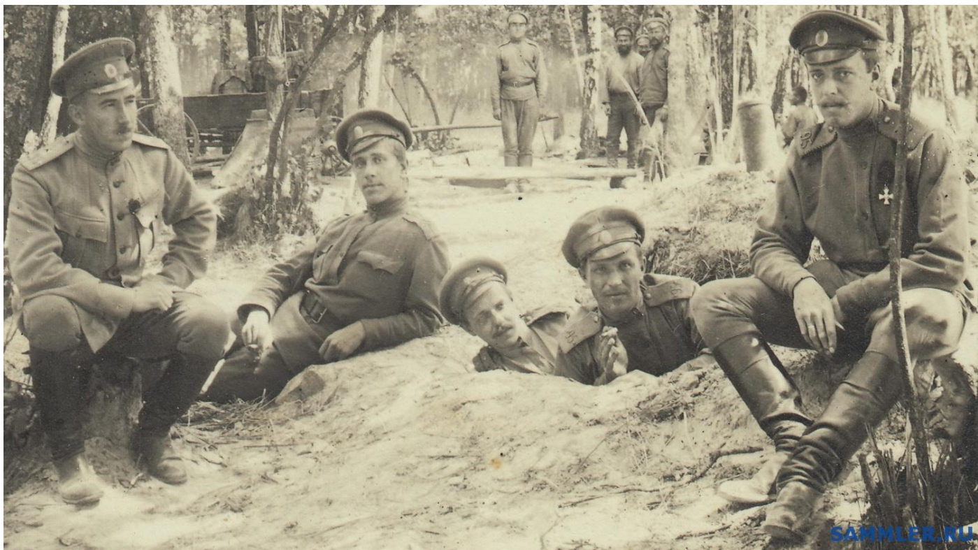
Офицеры полка на боевой позиции