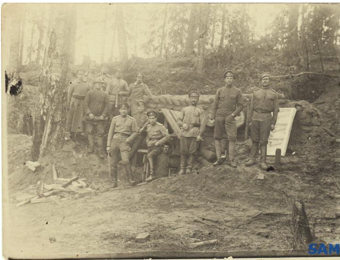
Офицеры и солдаты на боевой позиции