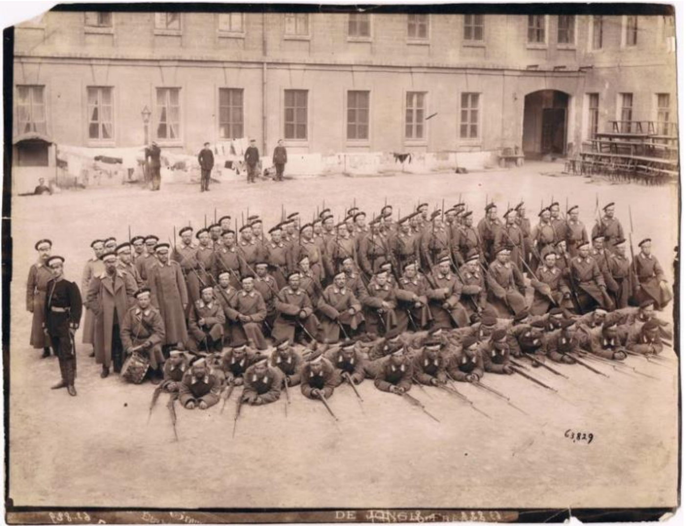
Солдаты и офицеры 59-го Люблинского пехотного полка