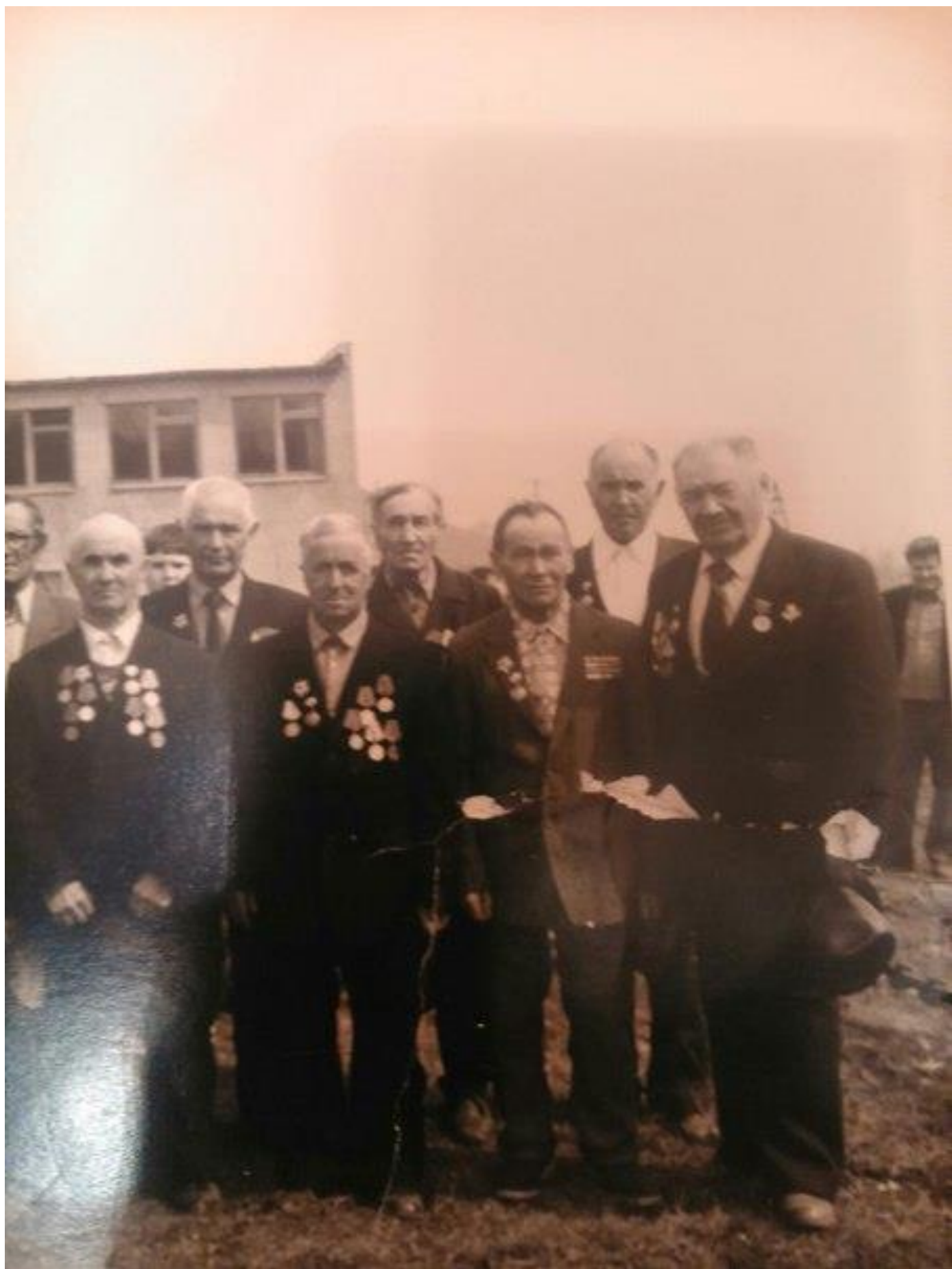
с.Ижевка, празднование дня Победы