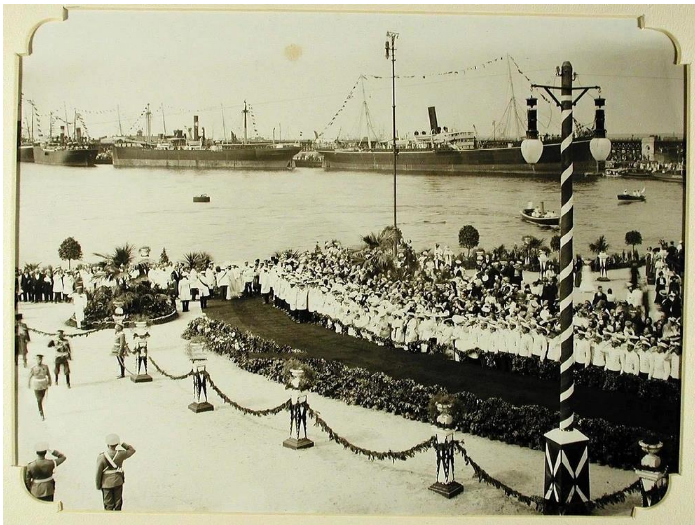
Император Николай 2 принимает рапорт начальника почетного караула 59 пехотного полка