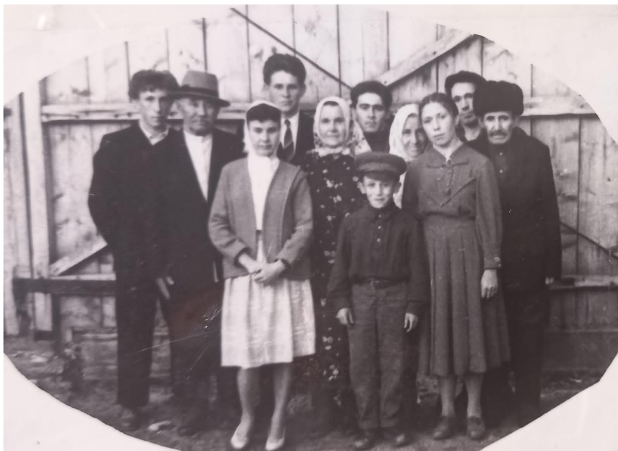
Хуҗиәхмәт абзый балалары белән