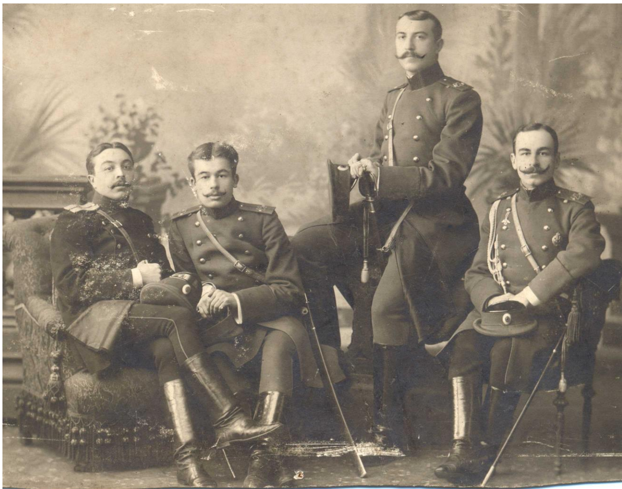
Офицеры 23-го Низовского полка