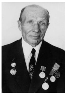
ФӘЙЗЕЛХАК ГЫЙЛЬФАН УЛЫ ХӨСНЕТДИНОВ (1916 – 2005)